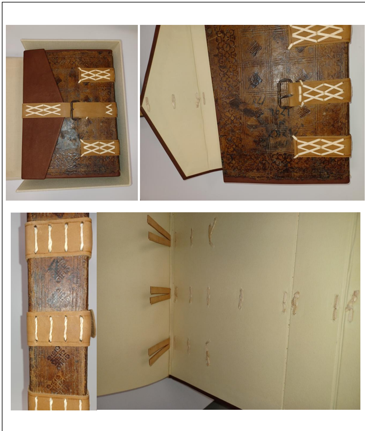
Figura 2 AS-PE, Fondo Corti locali, Corte di Serramonacesca (a. 1787 e ss.):

particolari del cofanetto rivestito in tela e della splendida legatura in cuoio gofrato, completa di cinghia di chiusura, fermata da fibbia di ferro, della tipologia cosiddetta "archivistica", caratterizzata dal fatto che «in essa il piatto posteriore si prolunga su quello anteriore con un risvolto, a mo' di busta, spesso con elementi di rinforzo, e i documenti vengono cuciti, in fascicoli, sul dorso a punto lungo o a catenella, mediante robuste strisce di cuoio che vengono fissate ai due piatti con strisciole incrociate di pelle o di pergamena» (MARIA LUISA AGATI, Il libro manoscritto da Oriente a Occidente. Per una codicologia comparata , Roma, «L'ERMA» di BRETSCHNEIDER, 2009, p. 379).