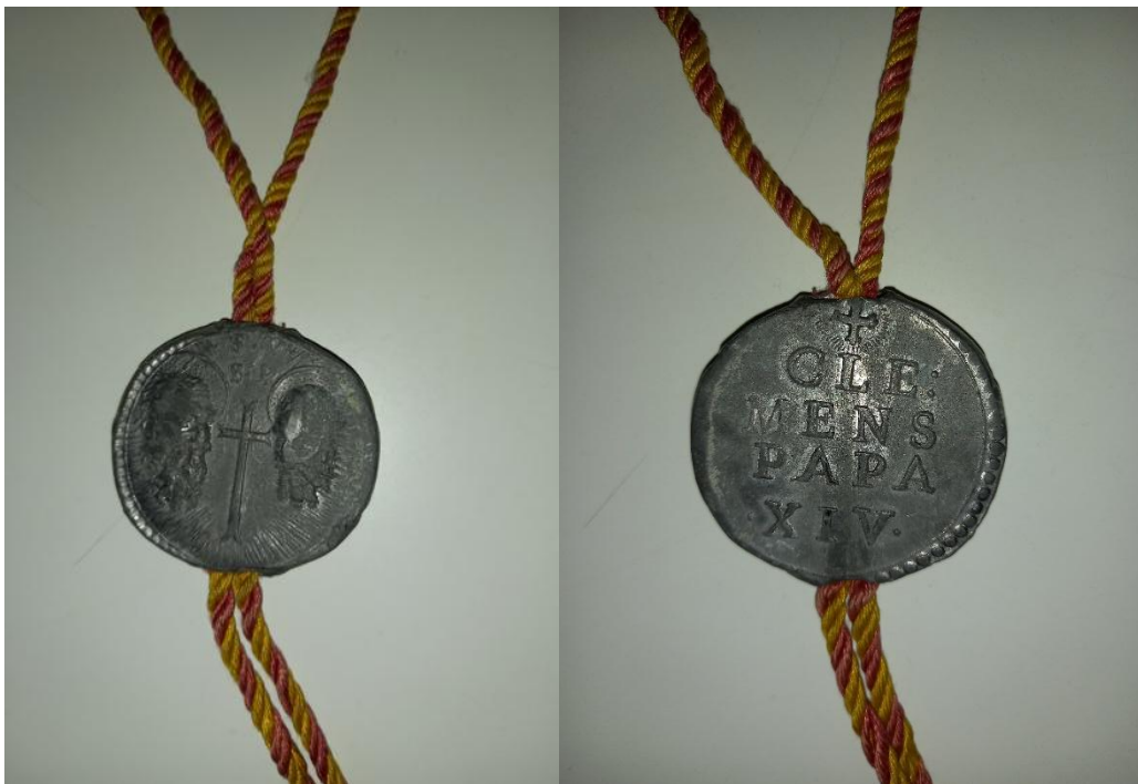
Figura 3 AS-PE, Fondo de Felici del Giudice, Perg. n. 339 (v. s.: 284): partic. recto e verso della bolla plumbea pontificia (vd. infra la scheda sfragistica)