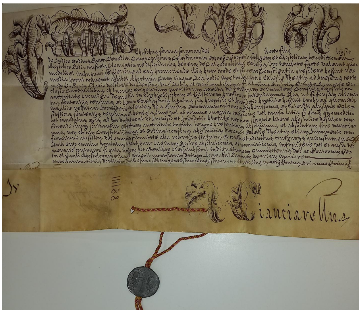
Figura 1 AS-PE, Fondo de Felici del Giudice, Perg. n. 339 (v. s.: 284): partic. recto

Clemente XIV, nel nominare Luigi Del Giudice arcivescovo metropolita di Chieti, rende la sua elezione inattaccabile e blindata contro ogni eventuale contestazione, assolvendolo da qualsivoglia scomunica, sospensione e interdetto o altro genere di sentenze, censure e pene ecclesiastiche, inflitte a jure o ab homine , in cui possa essere accidentalmente incorso.